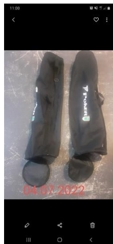
SACOLAS DE BOLAS