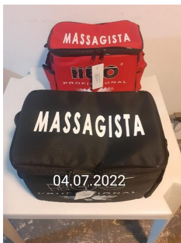
SACOLAS PRIMEIROS SOCORROS ENTREGA DO UNIFORME ESPORTIVO