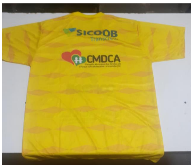
CAMISA AMARELA (GOLEIROS)