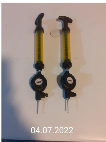
BOMBAS DE INFLAR BOLA