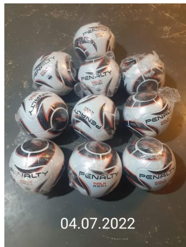
BOLAS PENALTY MAX 1000