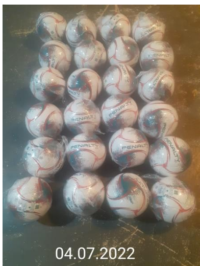
BOLAS PENALTY MAX 200