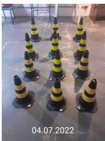
CONES DE BORRACHA